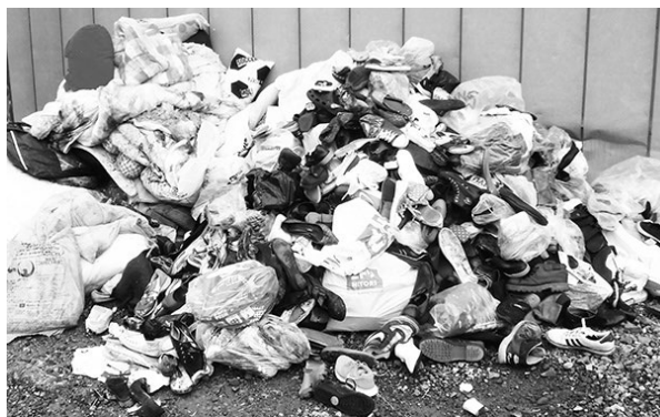
↑ 古布収集ボックスに不法投棄された靴