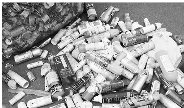
↑ 缶収集ボックスに捨てられたスプレー缶

スプレー缶は素材がスチールの場合でも、危険防止のために「金属類」での回収となります。駅東リサイクルステーションでは、収集できませんので、地区収集の「金属類」の日に出していただくか、月例収集（赤砂崎公園）、清掃センターへ直接持込みをしてください。また、必ず使い切り穴を開けてから出してください。