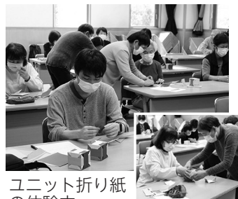
ユニット折り紙の体験中