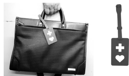
ヘルプマーク (ストラップ式)

ヘルプマークの片面に伝えたい情報が記載されています。マークを身に着けた方を見かけたときは、電車やバスの中で席を譲る、困っているようであれば声をかけるなど、思いやりのある行動をお願いします。