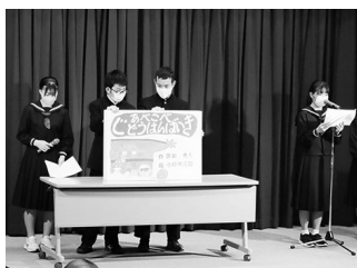
下諏訪社中学校生による読み聞かせ

館内の展示も、例年より盛りだくさんで、20周年をお祝いする雰囲気がいっぱいでした。