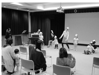
はなとみつばちコンサート