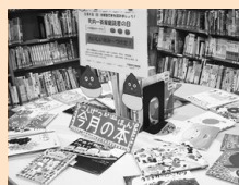
毎月のテーマボックス