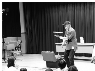
ミドンさんによる皿回し