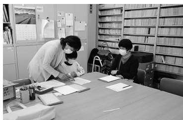
あかりの会による点字体験