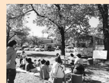
おはなしのへや(毎週木・土)

■ 問い合わせ 下諏訪町立図書館 ☎27-5555 平日(火～金)：午前9時30分～午後7時 土日祝：午後9時30分～午後6時