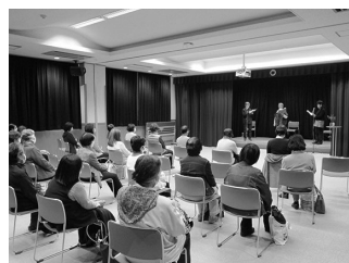
やまびこの会による朗読