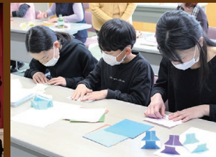
図書館まつりの様子