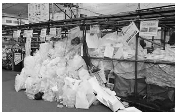
↑ 収集スペースからあふれ出るペットボトル

靴は令和3年4月1日より「資源物（古布）」ではなく、「燃やすごみ」に変更になりました。駅東リサイクルステーション、星が丘古紙古布リサイクルステーション、図書館横古布収集ボックスでは、古布の回収をしていますが、収集対象外の靴が多く出されています。収集していない品目を出すと、不法投棄になりますので、ご注意ください。