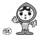
人権イメージキャラクター 人KENまる君